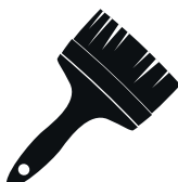
Brosse à encoller