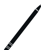
Crayon à papier